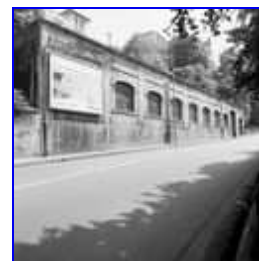
Vue ouest du dernier entrepôt des Usines Gillet

Partie(s) constituante(s) : entrepôt industriel